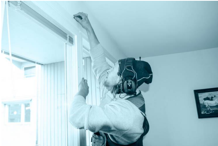
Lossa gamla lister