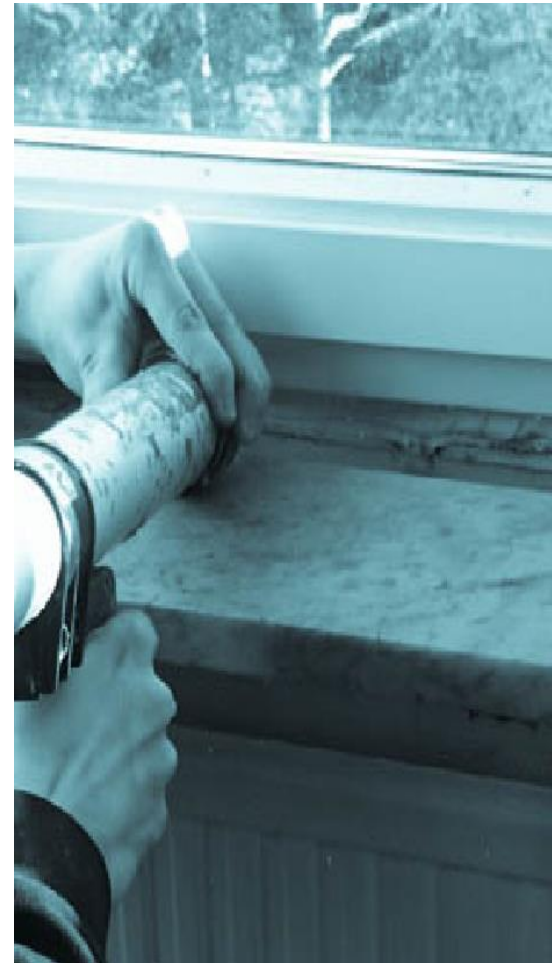
Tät fog runt om